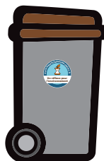
Bac déchets alimentaires